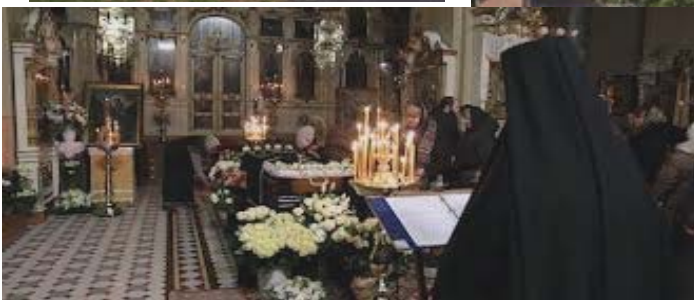
Vedhögarna i klostret