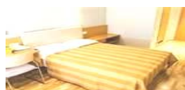
Pärnu Enkelrum Pärnu Enkel insideshytt båt