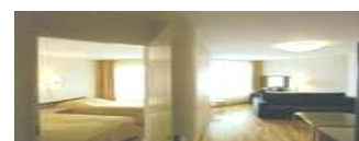
Del i Svit i Pärnu Dubbel insideshytt båt