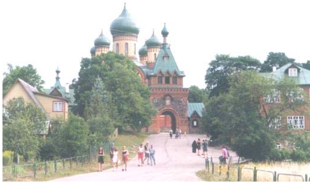
Klosterbyn i Kurramäe