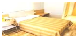
Pärnu Enkelrum Pärnu Enkel insideshytt båt