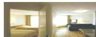
Del i Svit i Pärnu Dubbel insideshytt båt