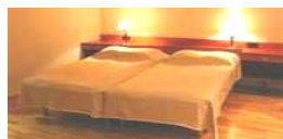
Del i Dubbelrum Dubbel insideshytt båt